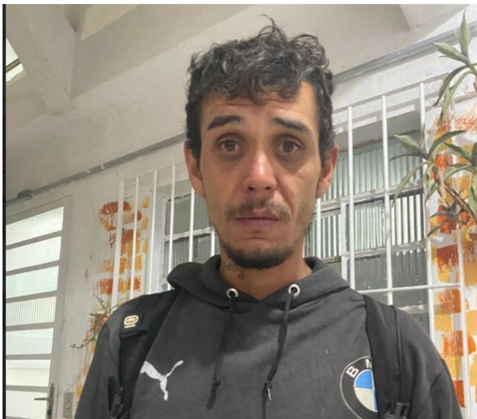
Figura 8: Atendido do serviço, fez ameaças a equipe e a outros conviventes – 26/08/2025