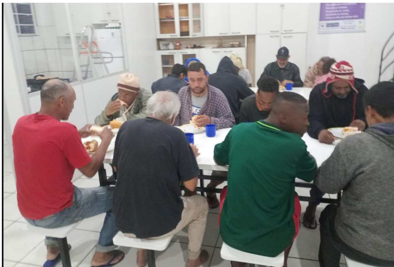
Figura 5: Noite do cachorro quente – 16/08/2025