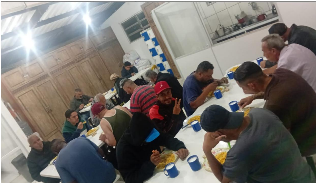
Figura 11: Café da Noite – 29/08/2025