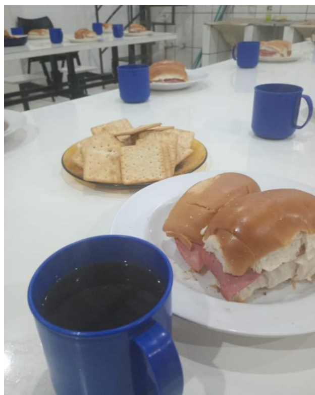
Figura 6: Café da Manhã – 20/08/2025