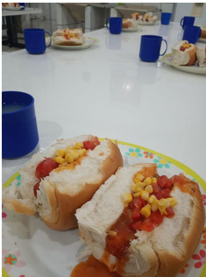
Figura 4: Noite do cachorro quente – 16/08/2025