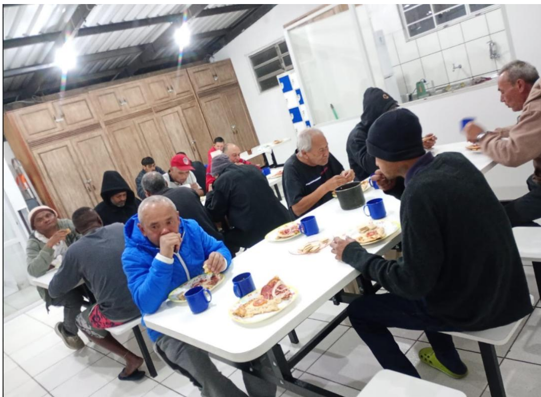
Figura 2: Noite da Pizza 07/08/2025