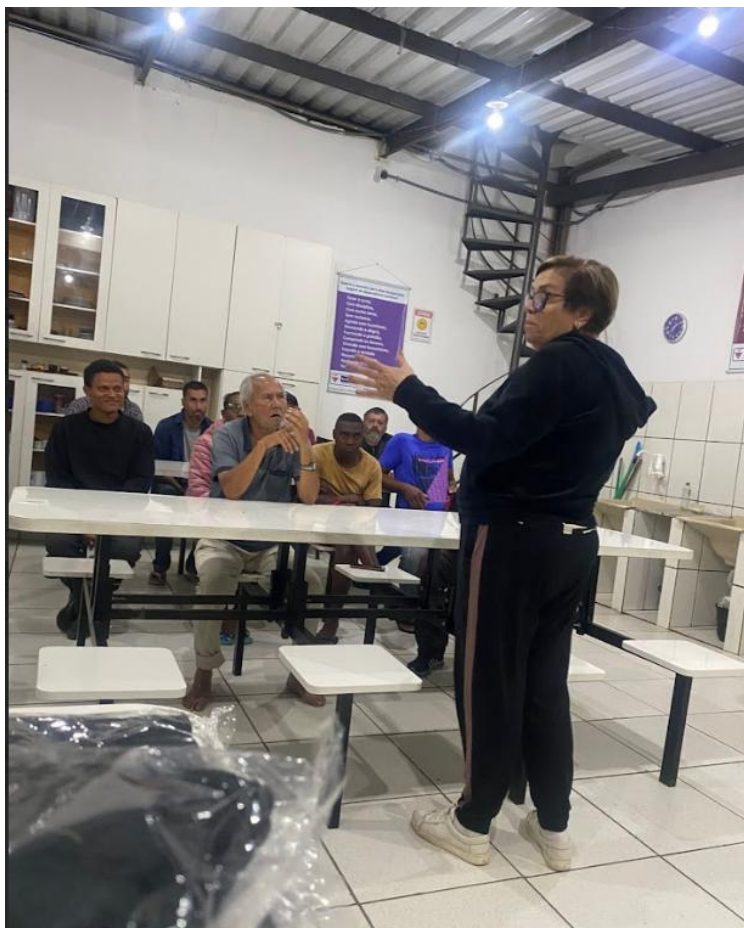
Figura 7: Roda de conversa – 24/08/2025