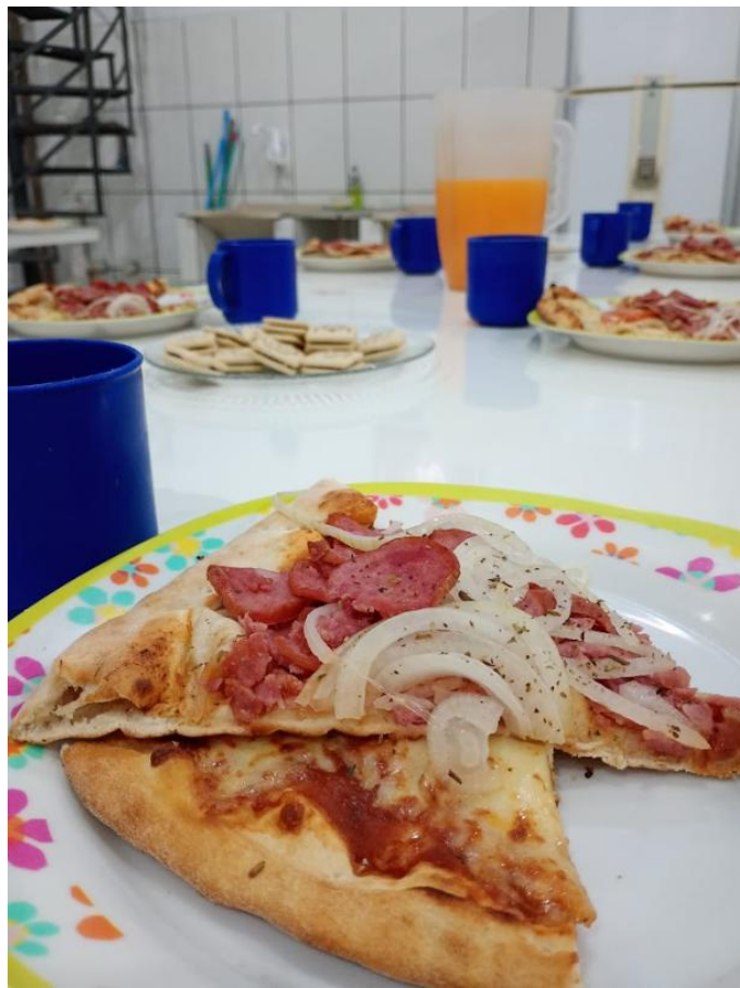
Figura 1: Noite da Pizza – 07/08/2025