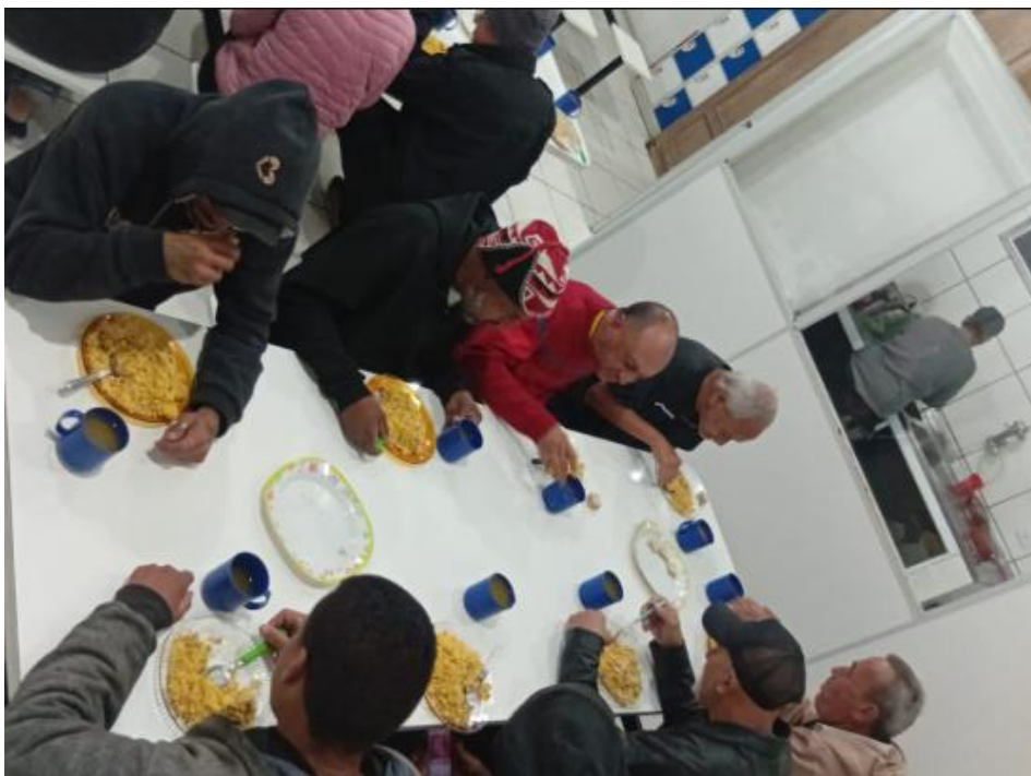
Figura 3: Noite do Cuscuz – 15/08/2025